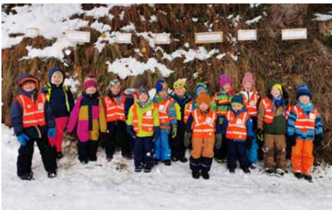
Beim Adventweg der Pfarre waren wir dabei.