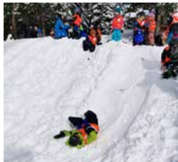
Juhee, Spaß im Schnee!