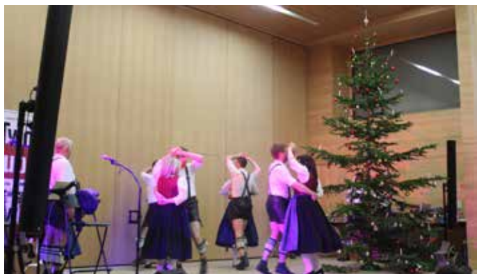
Schuhplattler Gruppe Zwischenwasser

Der Höhepunkt der Christbaumfeier war wiederum die Versteigerung der Äste mit den begehrten Päckle durch Alexander Etlinger und Siegmund Heinzle. Nachdem der Spitz des Baumes abgesägt und versteigert wurde, kam auch noch der Stamm dran. Unter all jenen, die ein Päckle ersteigerten, wurde zum Schluss noch ein Gutschein für ein Spanferkel im Wert von 300 € verlost. Als kleine Überraschung gab es eine Aufführung der Schuhplattler Gruppe Zwischenwasser. Mit einigen zünftigen Tänzen sorgten die Schuhplattler und Tänzerinnen für Unterhaltung und stellten die Schuhplattler Gruppe den Gästen vor.