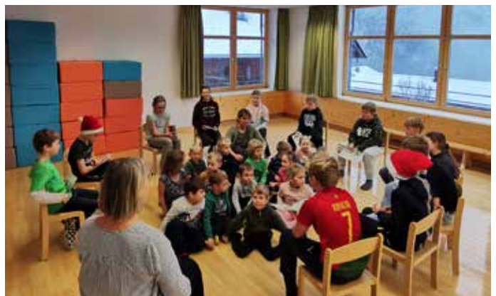
Die 4. Klässler der Volksschule besuchten uns und lasen uns eine spannende Geschichte vor.