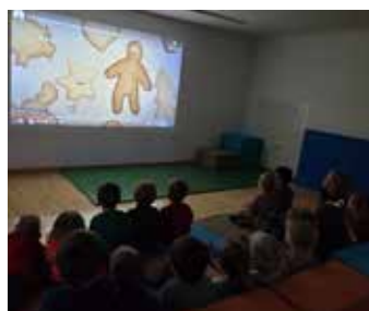
Weihnachtsfeier im Kindergarten mit Kino.