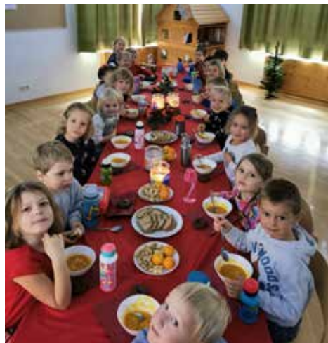
Den Namens- tag vom Hl. Nikolaus haben wir mit einer feinen Jause gefeiert.