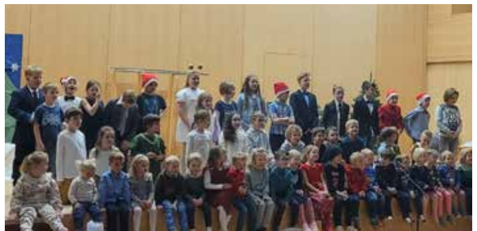
Große Adventfeier im Schulsaal mit allen Laternser Kindern von 3 bis 10 Jahre beim gemeinsamen Abschlusslied.