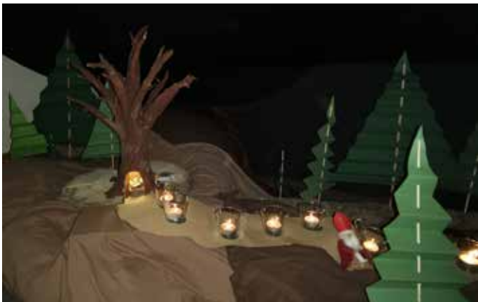
Unser Adventkalender ... ... der Weg durch den Wuselwald zur Krippe.