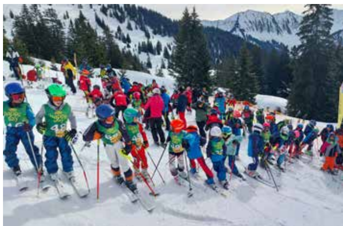
Schüler- und Kinderkaderläufer beim Rennlauf

Das 1. SCO-Rennen wurde vom Schülerkader in Brand am 03.01.2024 eröffnet: der Schüler- und Jugendkader ging mit 8 Läufer:innen beim Slalom an den Start. Dabei schafften es mehrere von ihnen auf das Podium und darüber hinaus wurden auch persönliche Bestzeiten gebrochen. Somit war das erste Rennen der Saison ein großer Erfolg für unser Schülerkader-Team. Alle haben bewiesen, dass sie einen starken Teamgeist besitzen und motiviert sind, das Beste aus sich herauszuholen. Wir sind stolz auf das Erreichte und sehen optimistisch in die Zukunft. Mit dieser beeindruckenden Leistung stehen uns sicher noch viele weitere Erfolge und spannende Wettkämpfe bevor.