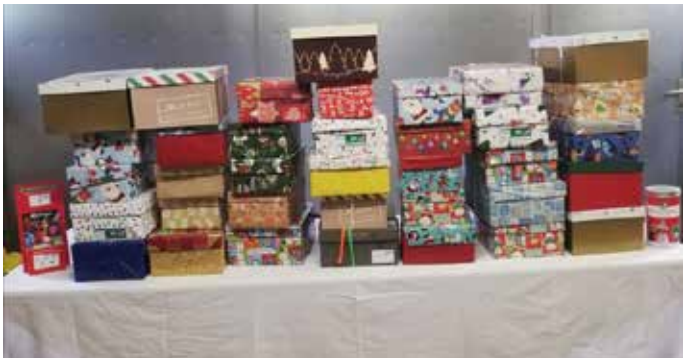
36 toll verpackte Schuhkartons