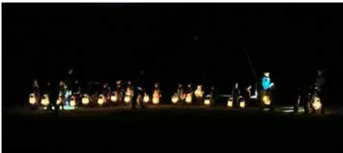
Stimmungsvolles Laternenfest beim Waldplatz.