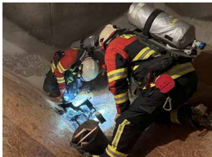
Atemschutzträger im Einsatz

Die Feuerwehr rückte mit dem Tanklöschfahrzeug sowie dem Löschfahrzeug aus und war mit 18 Einsatzkräften vor Ort. Mit schwerem Atemschutz wurde zuerst versucht die Pellets von Hand zu entfernen. Diese mussten allerdings maschinell abgesaugt werden, um an den Brandherd zu gelangen. Erst dann konnte die Brandausbruchsstelle von den Atemschutzträgern geöffnet und das Glutnest abgelöscht werden.