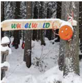
Auch im Schnee ist es wunderschön im Wuselwald.